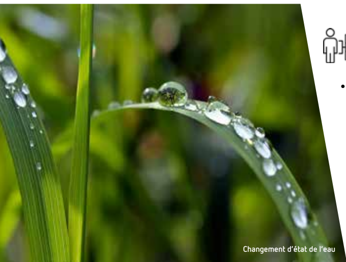
Changement d'état de l'eau