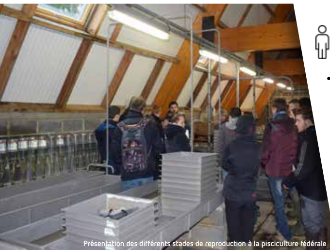
Présentation des différents stades de reproduction à la pisciculture fédérale