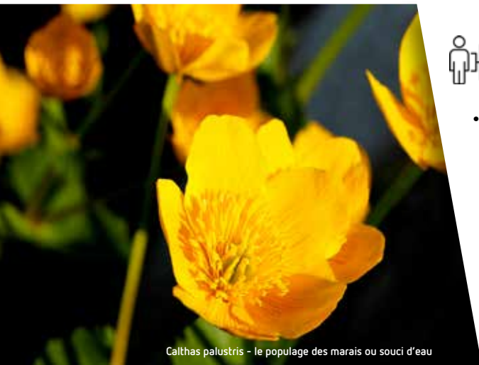
Caltha palustris - le populage des marais ou souci d'eau