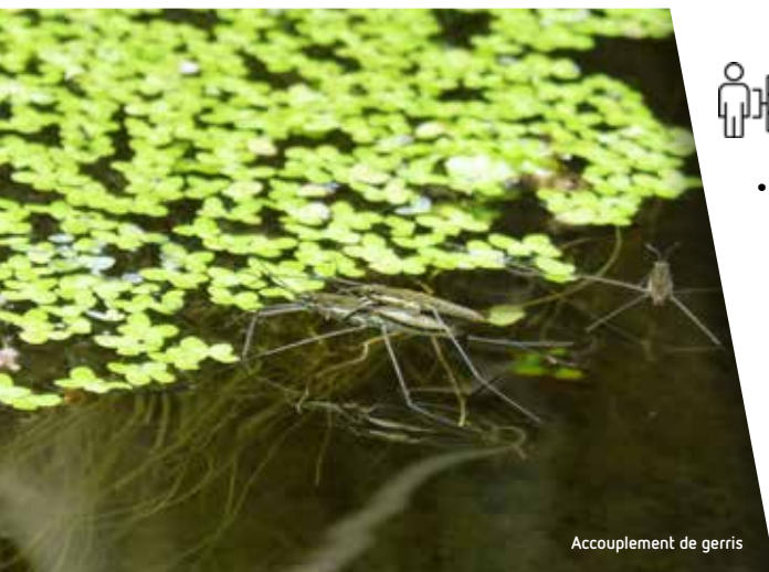
Accouplement de gerris