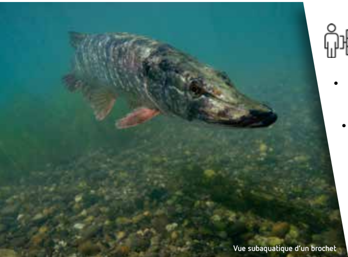
Vue subaquatique d'un brochet