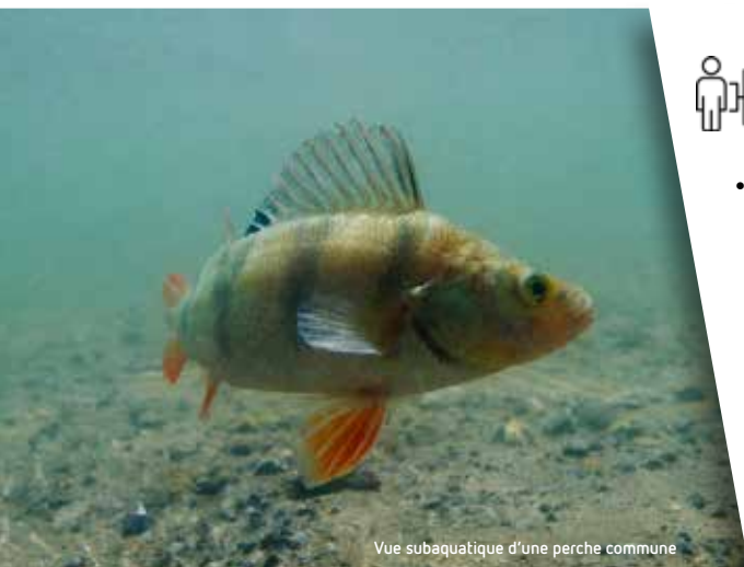
Vue subaquatique d'une perche commune